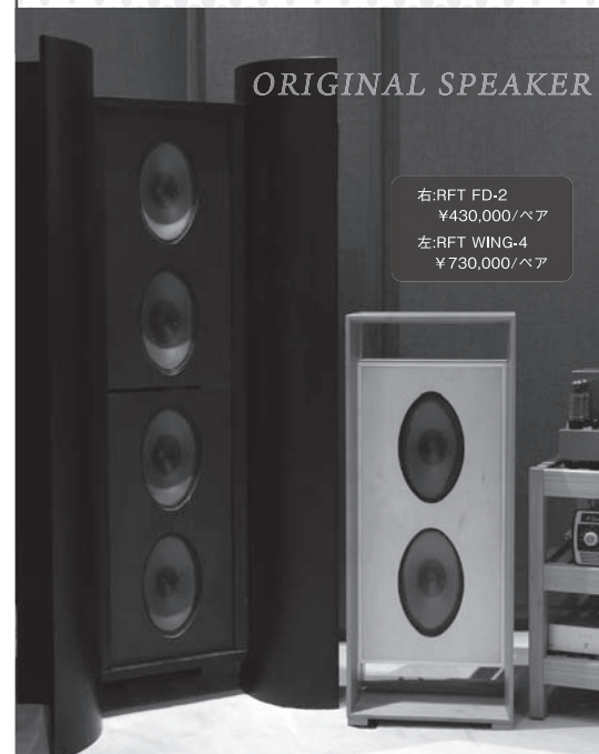
右:RFT FD-2 ¥430,000/ペア 左:RFT WING-4 ¥730,000/ペア

日々たくさんの音に触れるにつけ、ヴィンテージの魅力、現代システムの長所、そのどちらをも併せ持つスピーカーがないものかと考えてスタートしたオリジナルスピーカー製作プロジェクト!今回はその中からドイツのヴィンテージユニットRFTを使用し、とっておきをご紹介します。