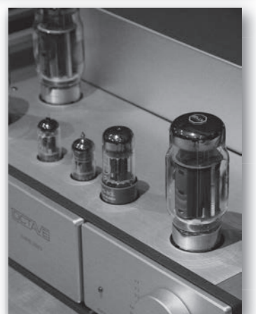
OCTAVE MRE220 200W MONO POWER AMPLIFIER 価格 ¥2,415,000/ペア

適切なプレート電圧をかけて、真空管式としては非常に高い220W(4Ω)という出力を達成しているのだから驚き。 また、真空管アンプの重要な構成要素の一つである出力トランスは、自社開発の「PM」コアを採用した新設計のもの。MRE220の開発におけるほとんどの時間を出力トランスと電源回路に費やしたと、OCTAVE代表のアンドレス・ホフマン氏は言います。入力トランスについては、実際の用途や接続機器との相性を考慮して、オーダー時に有り/無し/無しの選択が可能など、トランスを自社生産できる。 OCTAVEならではのこだわりも健在です。既にご覧頂いたお客様は「デザインも美しく、かつこのシャープなサウンドにおっしゃいます。MRE220における主要ポイントの一つだったようです。 沢山の技術的なノウハウの集積によって、究極の安定性をもたらした、超高性能アンプMRE220。しかもこれほどパワフルで音楽性豊かな真空管アンプは他にあるのでしょうか。 音楽愛好家の皆様へ、自信をもってお勧めいたします。 今お使いのパワーアンプの駆動力に不満の方、音楽にもっと生々しさ、リアリティーを感じたい方、MRE220は最高のアンプの一つ。必聴です!!