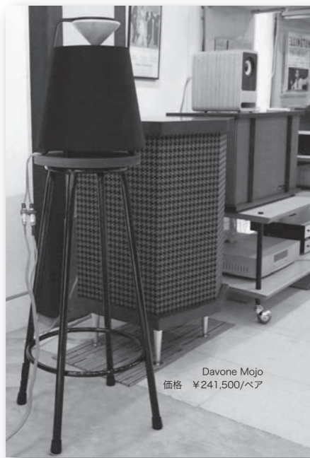
Davone Mojo 価格 ¥241,500/ペア

MojoiはLINN SEKRIK DS-Iと合わせて空間感たっぷり。SOUNDCREATE Legatoでは、その他にもシステム構成がシンプルな小型システムやウィンテージスピーカーもご用意しております。