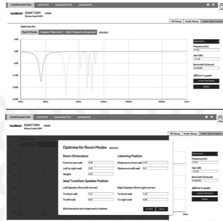
上図: KONFIG上の画面。上が、最適化された周波数特性のグラフ。下が、各数値入力画面。

これだけでも凄いのですが、さらには、実際に設置する場所にスピーカーを移動し距離を再入力すると、再演算処理によってベストポジションでの再生特性と同じ音質で音楽が楽しめるようになります。まさにこれ以上ない究極のシステムと言えるでしょう。